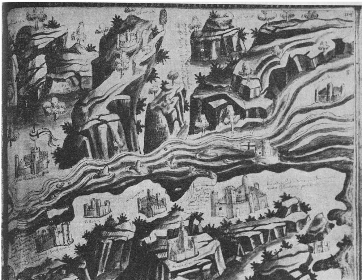
Planșa a II-a. — Aceeași hartă ( Cod. lat. Paris, 7239, f. 114 r. ). Reproducere parțială (același clișeu).